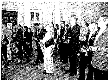
Im festlichen Ambiente des Stuttgarter Schlosses Rosenstein feierte der WLT seinen 40. Geburtstag.

1967 von der Sporttauchergemeinschaft Schwaben (heute SGS Ostfildern), dem Tauchclub Stuttgart, dem Tauchclub Heilbronn und Mitgliedern des späteren Tauchclubs Aalen gegründet, feiert der Württembergische Landesverband für Tauchsport (WLT) dieses Jahr sein 40-jähriges Jubiläum. Die festliche Jubiläumsfeier fand am 1. September, mit etwa 200 Gästen aus Mitgliedsvereinen, Tauchsport, Sport und Politik im Stuttgart Schloss Rosenstein statt.