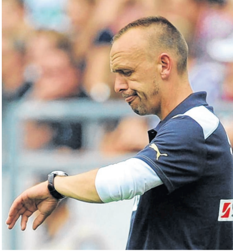
Das dürfte noch etwas Zeit benötigen: Holger Stanislawski muss bei seiner Mannschaft noch Grundsätzliches abstimmen.

Schritte Holger Stanislawski ist erst seit ein paar Wochen bei 1899 Hoffenheim. Doch schnell hat er erkannt: „Diese Herbstmeisterschaft ist fast schon ein Fluch.“ Seither geht es mehr oder weniger bergab. Seither haben die Spieler, so Stanislawski, „zu oft gehört, wie gut sie als